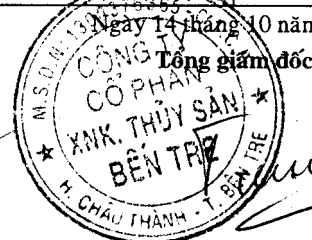
Đặng Kiệt Tường