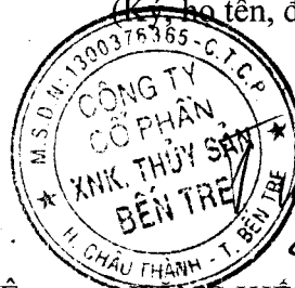
ĐẶNG KIẾT TƯỜNG